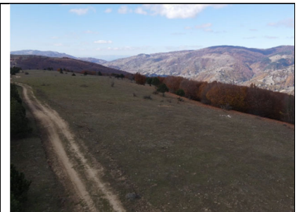
Windpark „R3-Çorum 1 RES“